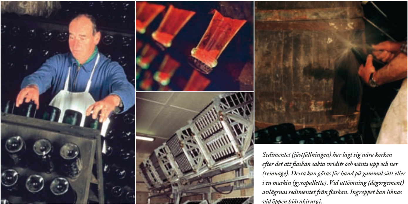
Sedimentet (jästfällningen) har lagt sig nära korken efter det att flaskan sakta vridits och vänts upp och ner (remuage). Detta kan göras för hand på gammal sätt eller i en maskin (gyropalette). Vid uttömning (dégorgement) avlägsnas sedimentet från flaskan. Ingreppet kan liknas vid öppen hjärnkirurgi.

flaskorna lagras därför med sedimentet minst 15 månader för en N.V. eller multi vintage om man så vill, alternativt tre år för en årgångschampagne. De bästa producenterna väljer ofta att lagra en N.V. i minst tre år och en årgångschampagne i sju till tio år.