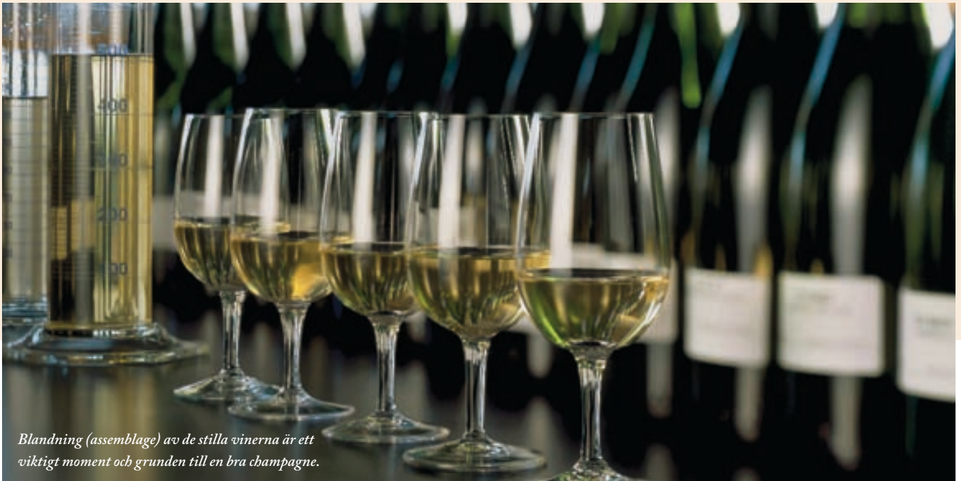
Blandning (assemblage) av de stilla vinerna är ett viktigt moment och grunden till en bra champagne.

druva som täcker 29 procent av den odlade ytan och återfinns söder om Epernay i Côte des Blancs och i Côte de Sézanne som ligger ytterligare lite längre söder ut. Pinot Noir är en blå druva med vit fruktsaft som odlas på cirka 37 procent av ytan. Den odlas fram-förallt i Montagne de Reims och Aube. Slutligen Pinot Meunier med 34 procent, även den blå med vit fruktsaft, som odlas längs floden Marne. Varje druva har sin egen karaktär och åldras olika vilket i sin tur beror på var den odlats, vinifikationsteknik etc. Chardonnay bidrar med fräsch citrus i unga år och utvecklas därefter alltmer åt mandel, rostat bröd och kandrade apelsinskal. Pinot Noir är röda bär som efterhand drar åt mogen, mörk frukt. Meunier har mycket mjuk, exotisk fruktarom med låg syra och åldras därför också fortare än de första två.